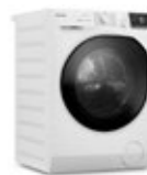
Lavadora y Secadora